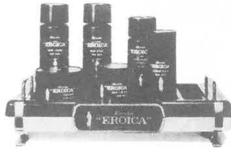
紳士用化粧品エロイカシリーズ

エロイカのあの独特の清涼感とまろやかさ、 心にゆとりを生む気品ある香り。英雄は英雄 を知るとか。エロイカは、あたくのサウナに 一級のお客さまを呼ぶでしょう。