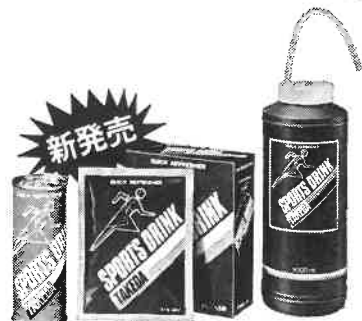
無炭酸タイプ 粉末タイプ(1用) ストイスポトル