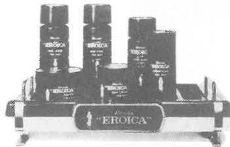
紳士用化粧品エロイカシリーズ

エロイカのあの独特の清涼感とまろやかさ、 心にゆとりを生む気品ある香り。英雄は英雄 を知るとか。エロイカは、あたくのサウナに 一級のお客さまを呼ぶでしょう。